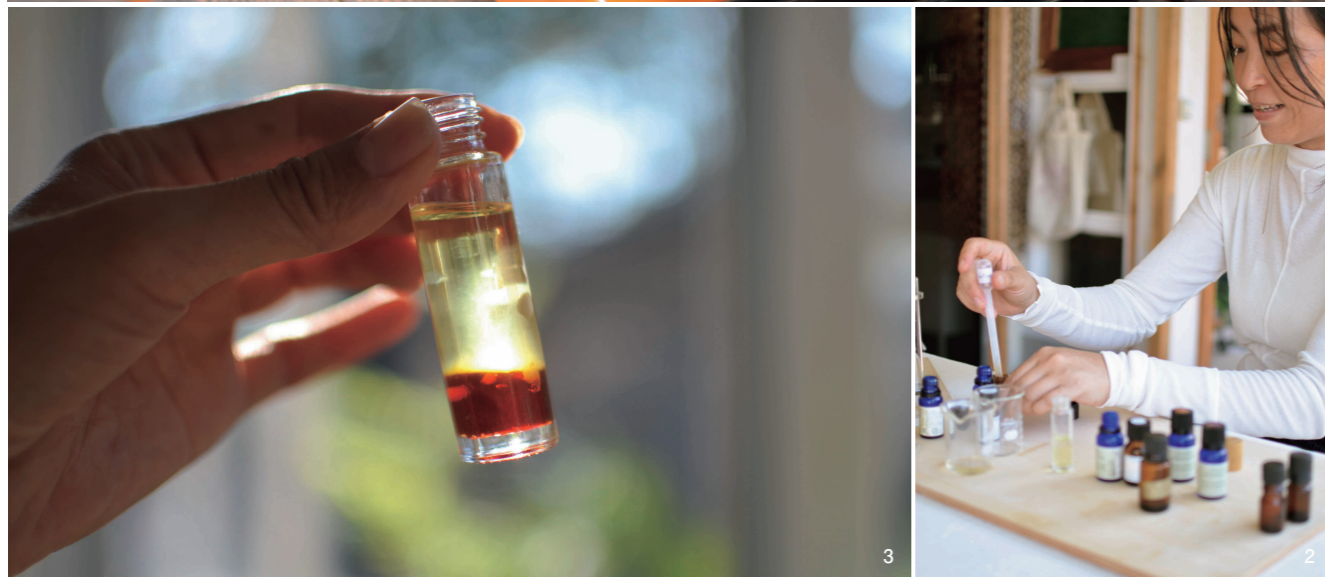
1. AEAJアロマセラピーアドバイザー・インストラクターの三穂さん。今の気分にあう香り体験ができる 2. 三穂さんは企業とコラボしてオリジナルアロマの開発も行う 3. 天草の蜜蝋や椿油、オリーブオイルを使ったアロマクラフト体験

ハイビーチ・リラックス ※来店・体験ともに前日までの要予約 天草市天草町高浜北897-26 Tel. 090-6941-9624