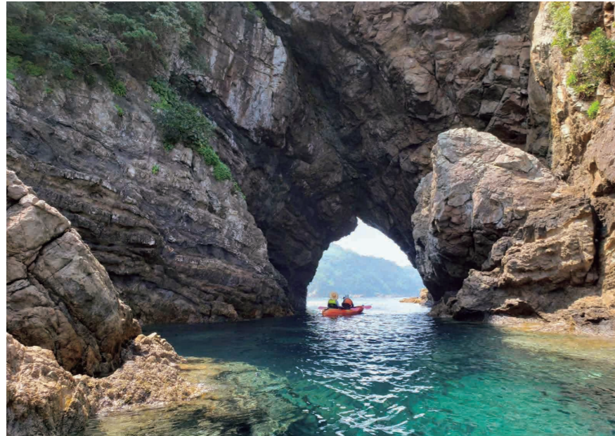
「象さん岩」の洞穴をくぐるカヤックツアー