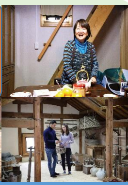
一軒家に宿泊し菊池の自然と手作り料理を五感で堪能