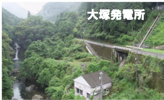
水圧鉄管点検用専用通路を歩行